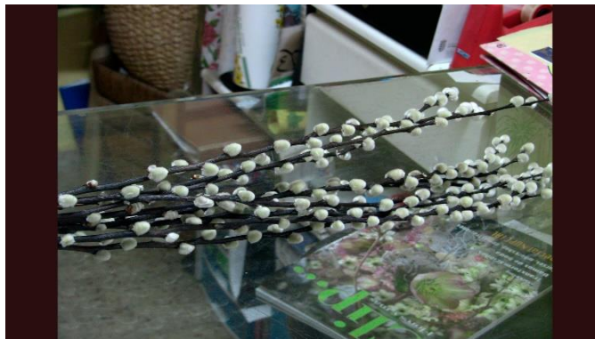
Figura 16. Arbre del cotonet.