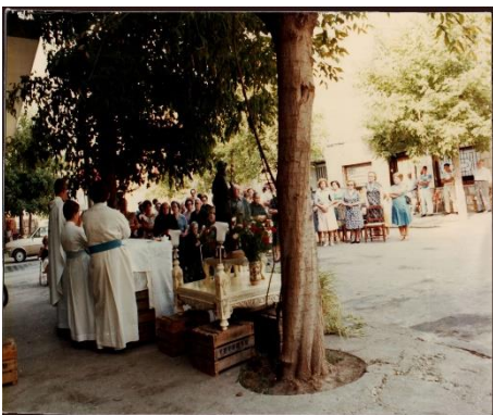
Figura 24.