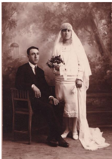
Figura 1. Col·lecció d'Eloísa Molés.