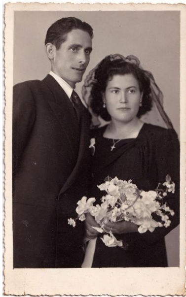
Figura 11. Col·lecció de Puri Castillo.