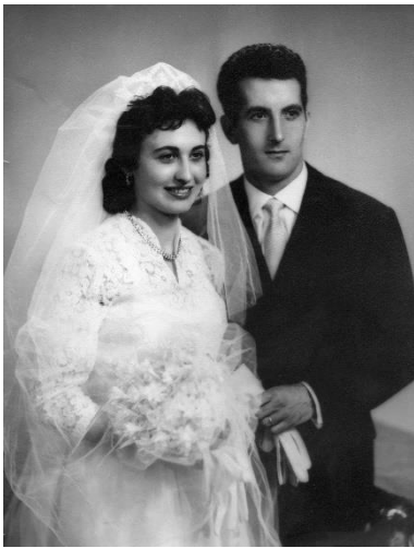
Figura 13. Col·lecció de la família Usó i Arnal.