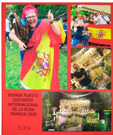
Figura 28. Cartell de guanyadors.