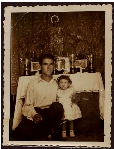
Figura 15. Col·lecció de Rosa Ros.