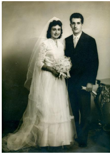
Figura 14. Col·lecció de la família Usó i Arnal.