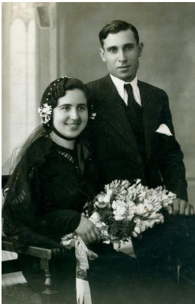
Figura 5. Col·lecció de les famílies Usó i Arnal.

Ací ja estem parlant d'un atra cosa. Ací estem parlant de flors naturals, açò són nardos, però sí que és veritat que açò és artificial. Ja dude... açò són nardos. Açò és artificial, açò són roses artificials, i açò és el helecho de... estarà mesclat segurament, perquè açò jo casi asseguraria... El nardo dudaria, pot ser natural, i açò és esparraguera i helecho, que n'hi havia en totes les cases. Esta me cabe la duda, pot ser magnólia, que tamé n'hi haven en tots els puestos, en la majoria de cases, i ací ja comencen a utilitzar el paper albal. Que això va ser durant uns anys el referent. Perquè això no eixia l'aigua, si era natural a l'estar el tronc banyat no se n'eixia l'aigua d'ahí.