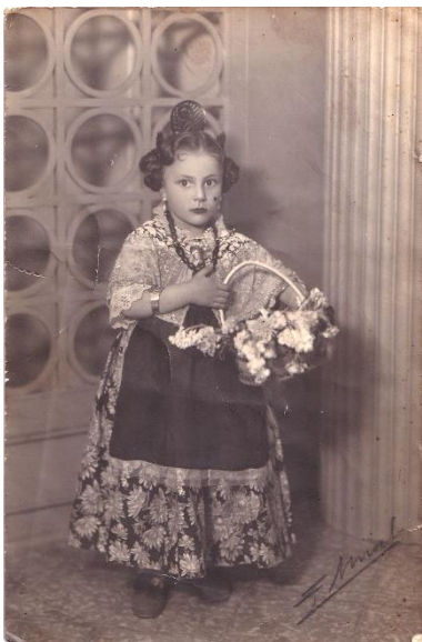
Figura 17. Col·lecció de Paquitín Martínez.