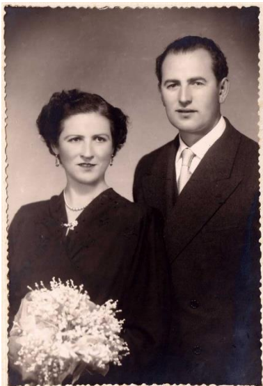
Figura 12. Col·lecció d'Éder Bello.

Sí, estes... tengo duda. Podria estar mesclat. Açò me dóna la sensació de que és natural, són les azucenes que diem, açò són clavells, azucenes i clavells, però me xoca açò: podria ser la punta de l'azucena però la veig massa perfecta. Podria ser mesclat, però sí: esparraguera-helecho, que tamé n'hi havia en les cases, però és que esta és tan perfecta que lo dudo. Però jo diria que és clavells i azucenes, lo que ara diem el lílium. Quan obre és esta, entonces és azucena, que és la que és olorosa. Això s'ha perdut com a varietat de corte, no es produix i s'ha perdut, però hi ha cases on seguix existint. Les azucenes: l'azucena ha desenvocat en el oriental logi-lilium .