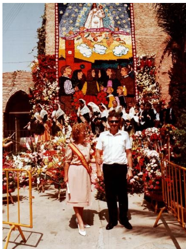
Figura 21 i 22. Col·lecció de Delfina Llorens.