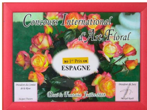
Figura 28. Primer Premi del Concurs Internacional d'Art Floral.

N'hi ha que... per exemple, el any en què jo sóc campeona és la llepoleria i les roses, sempre és lo que siga i les roses. Se dona el tema i tu desenvolles el... fas el treball en base a això, tens que preparar-ho tot i, per exemple pa mosatros que viatgem en avió no portem res darrere. Quan anàvem en furgoneta pues portaves alguna cosa, però és més còmodo l'avió, evidentment. Entonces se