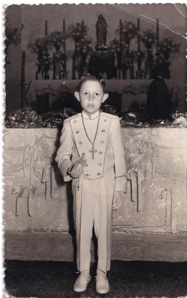
Figura 18. Col·lecció de Puri Castillo.