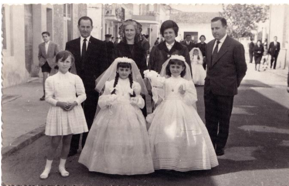
Figura 20.