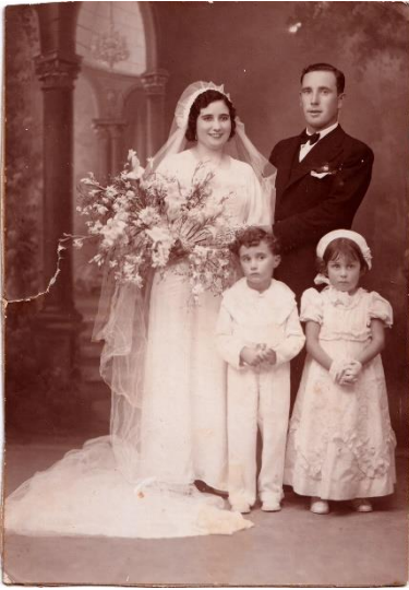
Figura 2. Col·lecció d'Eloísa Molés.

Ixa és una de les coses que no t'hem preguntat.